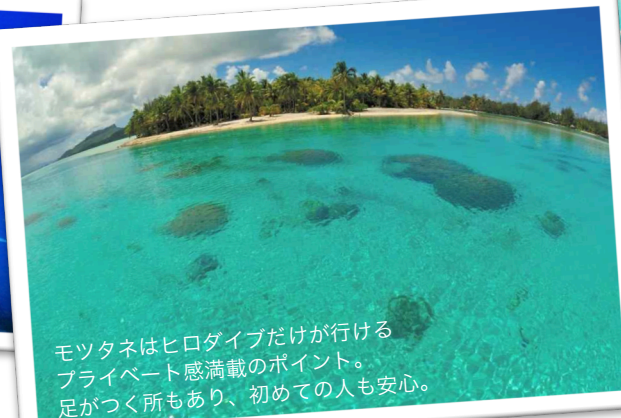
モツタネはヒロダイブだけが行けるプライベート感満載のポイント。足がつく所もあり、初めての人も安心。