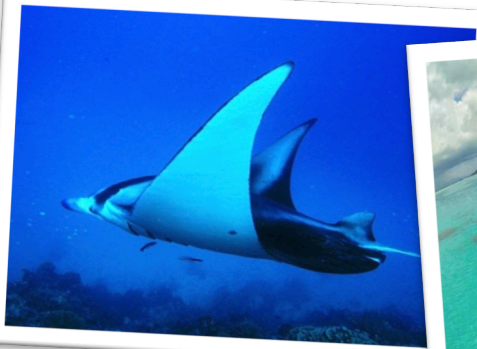
人気のマンタポイントでマンタを探す！